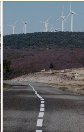
Col du Pendu – vue sur Cham Longe