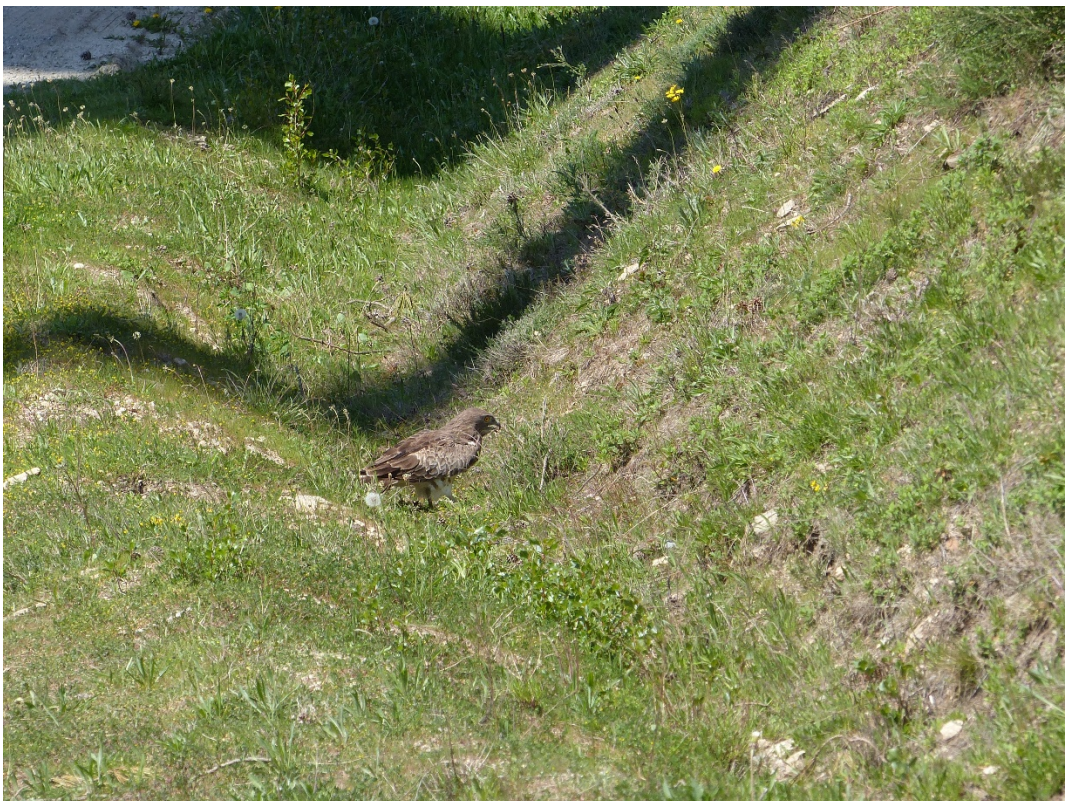
Circaète dans le fossé face à l'éolienne E7