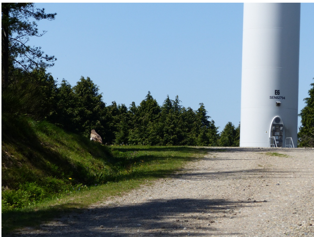
Circaète qui s'est déplacé jusqu'à l'éolienne E6 où il a été capturé