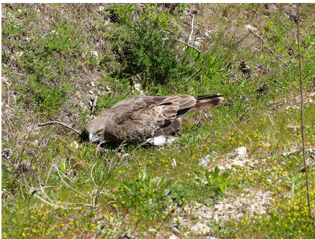
Circaète retrouvé dans le fossé face à l'éolienne E7